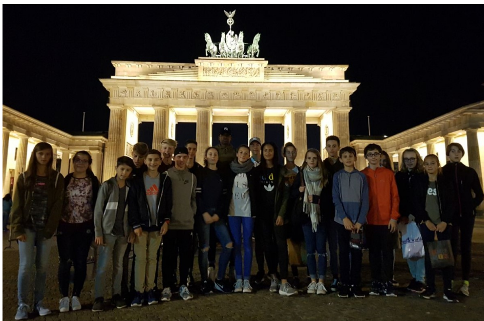
Gruppenbild Saar-Team am Abend vor dem Lauf am Brandenburger Tor