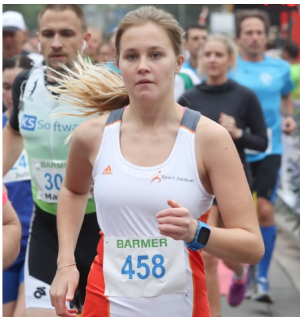
Nina – Halbmarathon