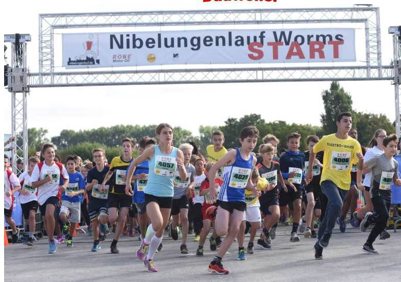
Start 5km Schülerlauf