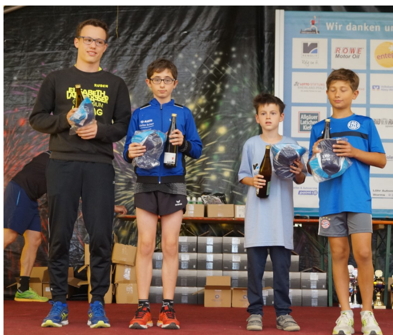
Siegerehrung der Altersklassensieger U16-U14-U12 und U10