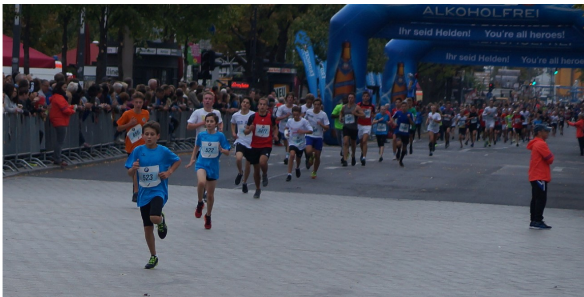
Leon an zweiter Stelle